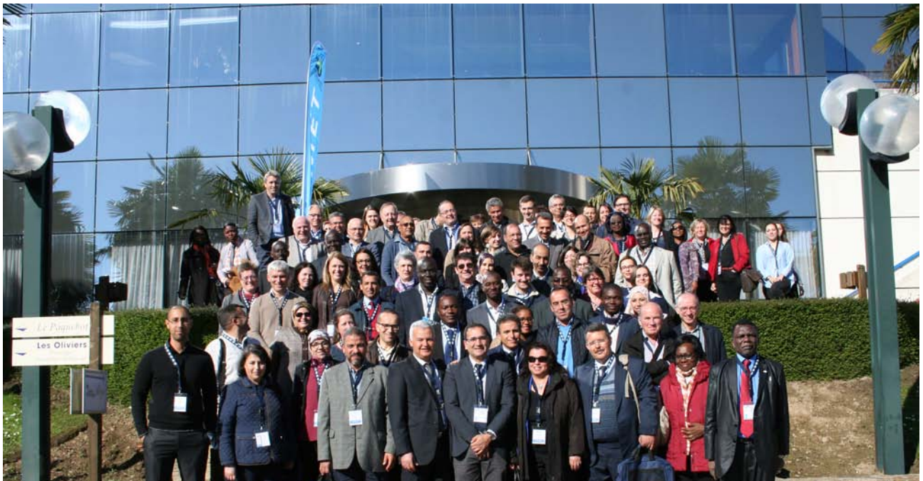
Les participants des RFQM 2017 – Photo prise le 27/03/17 devant le centre des congrès

L'équipe du CAFMET remercie l'ensemble des participants et des adhérents et vous invite à envoyer vos propositions de communication pour les futurs événements du CAFMET : CAFMET 2018 à Marrakech du 9 au 12 avril 2018 ( contact@cafmet2018.com – www.cafmet2018.com ), RFQM 2019 à Nantes du 25 au 28 mars 2019 ( contact@rfqm2019.com – www.rfqm2019.com )